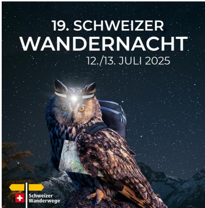
Dieachteule – Key Visual Schweizer der Schweizer Wandernacht