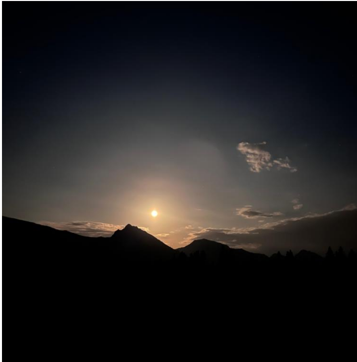
18. Schweizer Wandernacht 2024