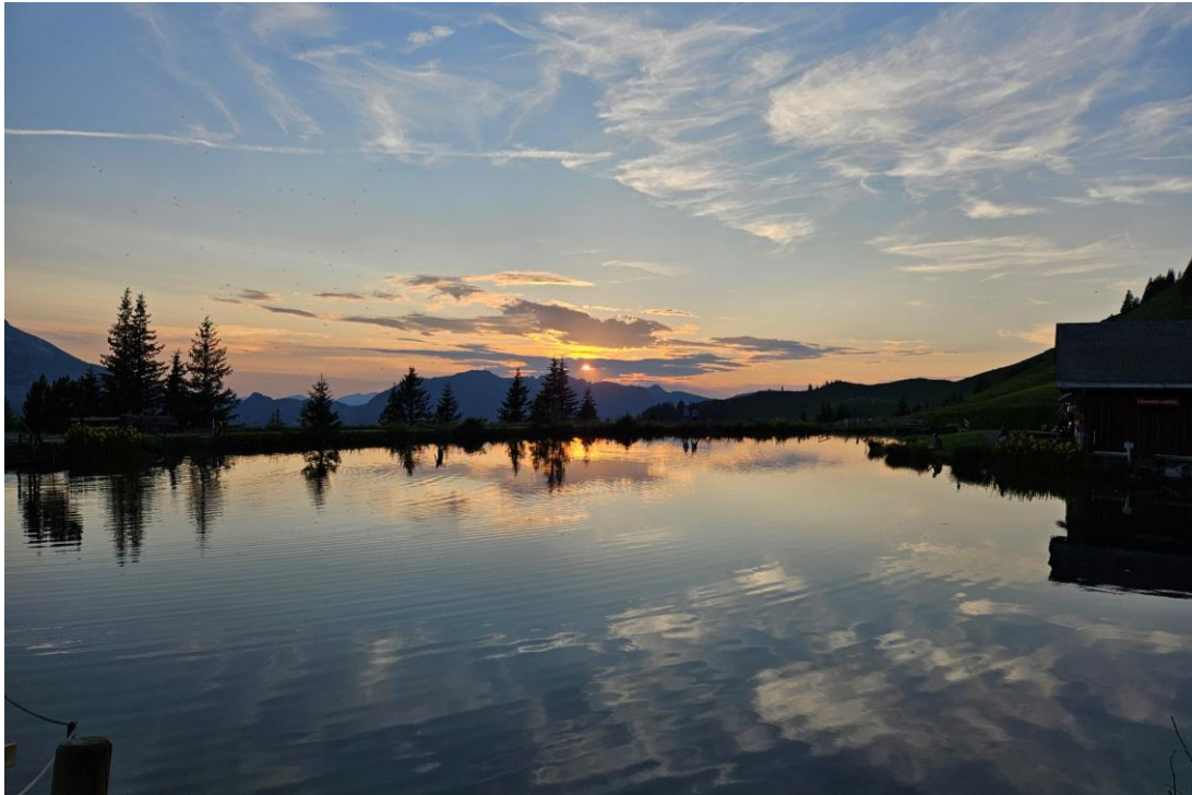
18. Schweizer Wandernacht 2024