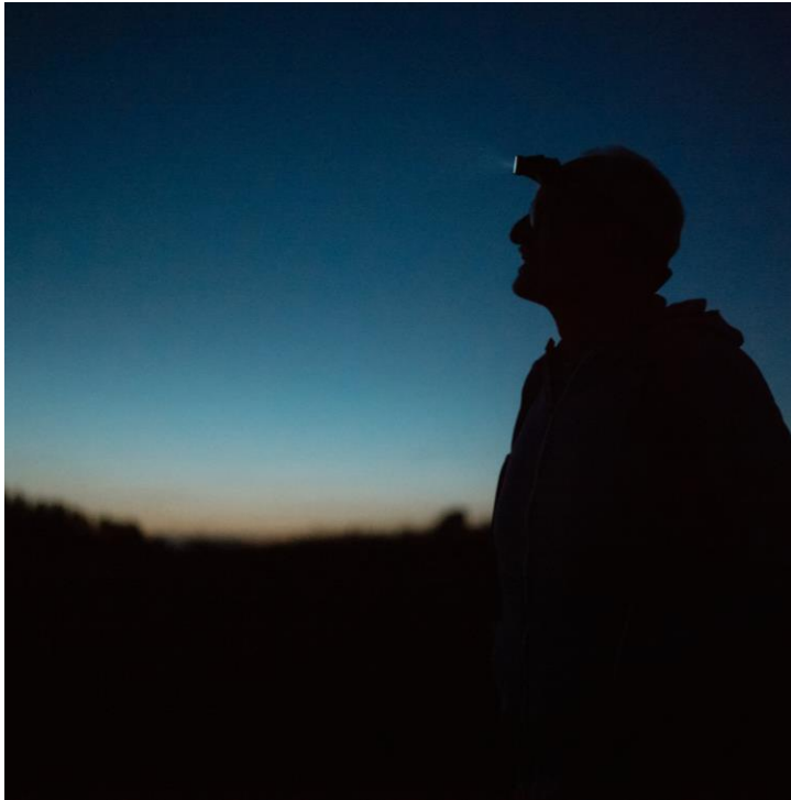
18. Schweizer Wandernacht 2024