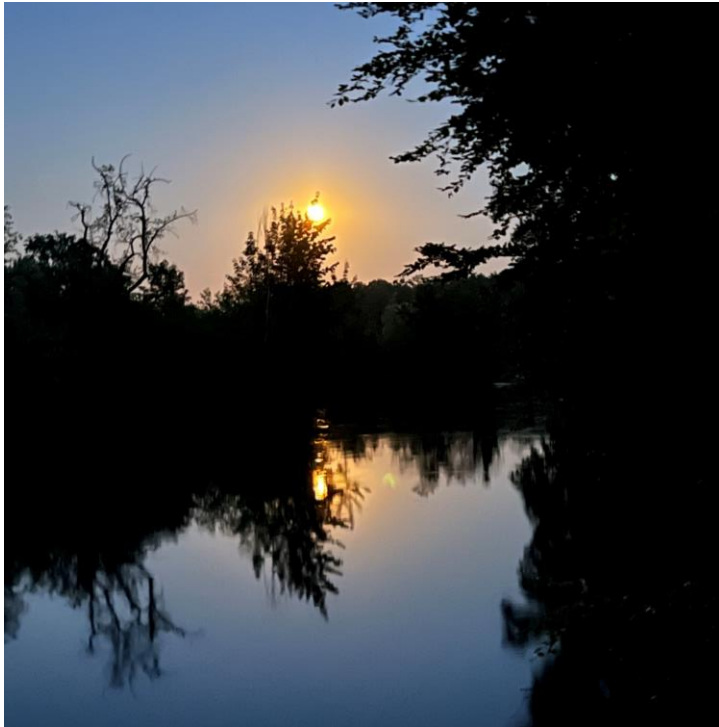
18. Schweizer Wandernacht 2024

Wie Sie als Veranstalter:in von den Schweizer Wanderwegen unterstützt werden