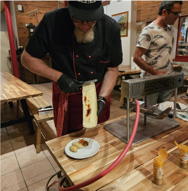
178 Schweizer Wandernacht 2024

So könnte Ihr Angebot aussehen – Wanderung mit Rahmenprogramm (optional)