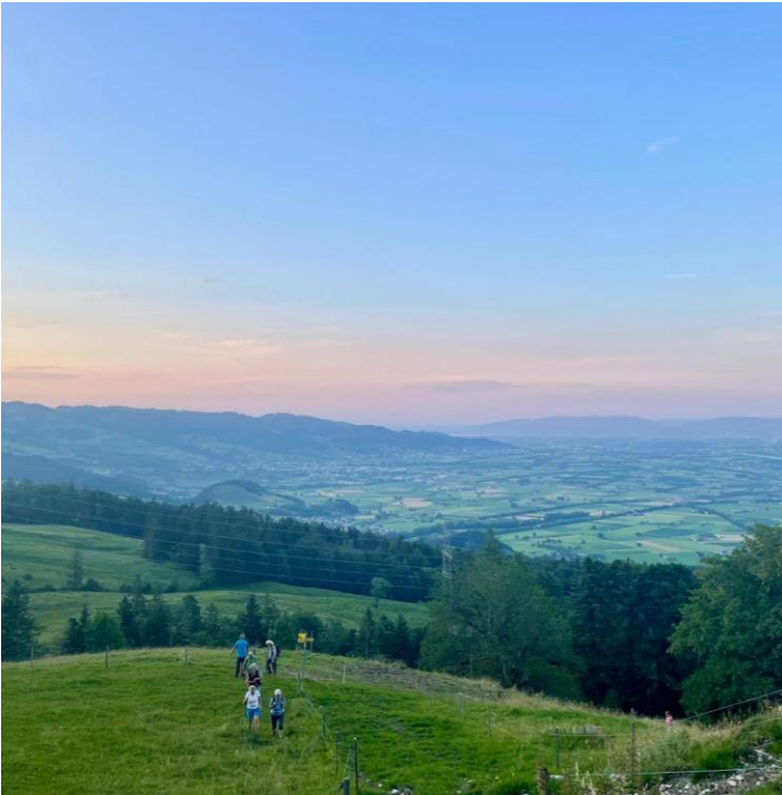
18. Schweizer Wandernacht 2024