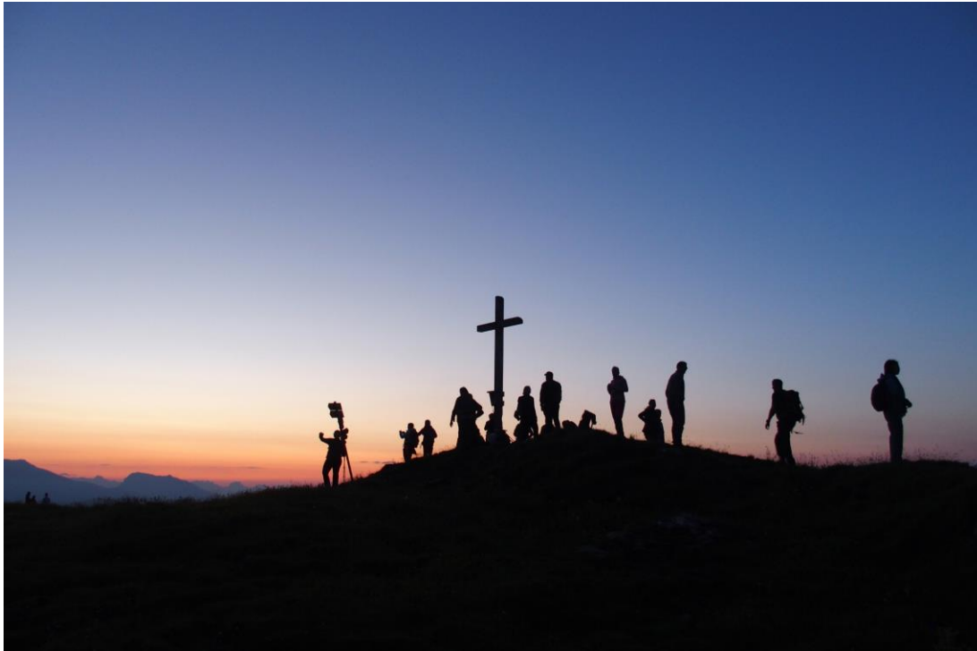
Bild: Surselva Tourismus Info Lumnezia 18. Schweizer Wandernacht 2024

Warum Sie als Veranstalter:in dabei sein sollten