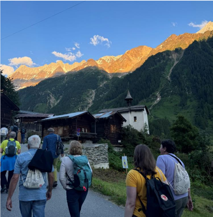
18. Schweizer Wandernacht 2024