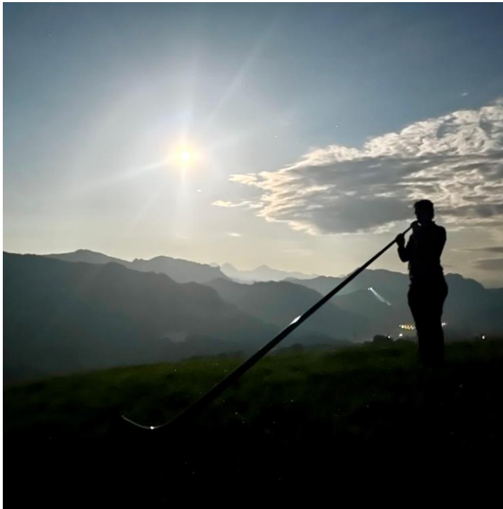
18. Schweizer Wandernacht 2024